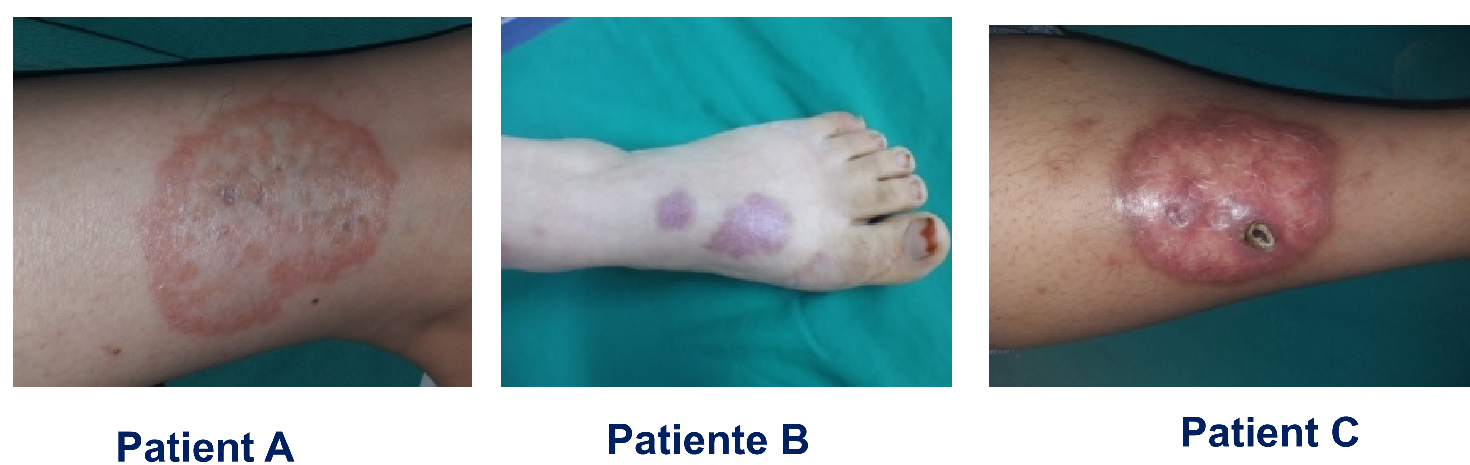
Figure 1: lésions cutanées de nécrobiose lipoïdique chez trois patients